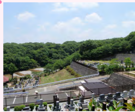
東京都 / 八王子市 八王子メモリアルパーク