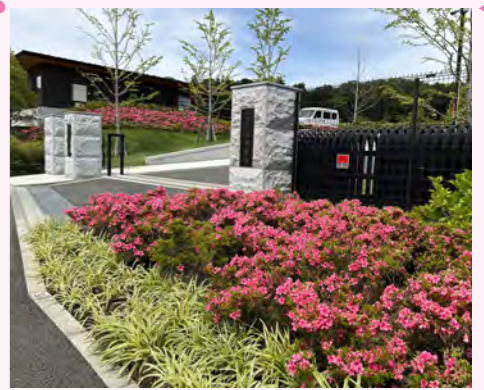
神奈川県 / 横浜市 川井聖苑

完成総額 97.1 万円からと、金額的にもお求めやすくペットも一緒に入れることで人気の 1.0㎡花壇墓所。残り区画わずかとなりました。ご検討の際は早め！