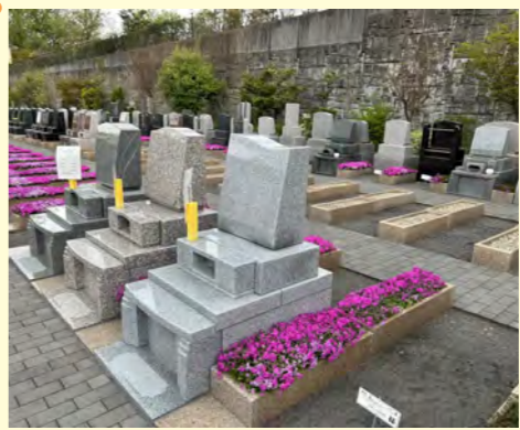
東京都 / 町田市 町田こもれびの杜霊苑

完成総額 59.8 万円！ 大変お求めやすい区画が限定 20 区画で登場しました。0.65㎡と価格に対して十分な広さも確保。価格重視でお探しならここは外せません！